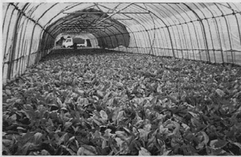
「鮮緑」使用で見事な生育を示した伊藤 チエさんの3作物 (8月3日)

発行所 株式会社園芸新聞社 〒180-0001 武蔵野市 吉祥寺北町4-7-13 電話 0422(5) 8953 FAX 0422(55) 7187 発行人 前田 暉 購読料 1ヵ年5,250円 振替 00130-2-85300